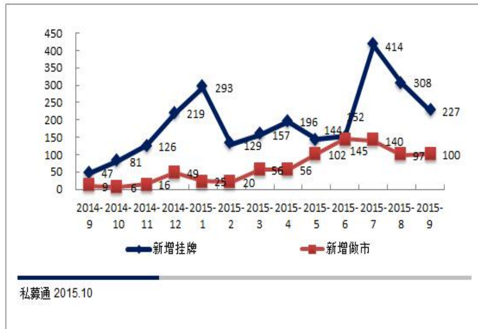
图1 2014年9月到2015年9月挂牌企业数量变化

根据清科旗下私募通统计，截止到2015年9月30日，新三板挂牌企业数量达到3583家，其中转让方式采用做市转让的共有858家，协议转让的共有2727家。2015年9月新增挂牌企业有227家，环比下降35.6%，同比增长79.3%；做市转让企业9月新增100家，环比增长3.00%，同比增长91.0%。跟7月414家的挂牌家数相比，可以看出企业挂牌潮在渐渐平静，但是227家与历史水平相比，仍处于高位，同时做市的企业数量没有大的变化，从新增挂牌企业的情况来看新三板处于平稳发展的状态中。