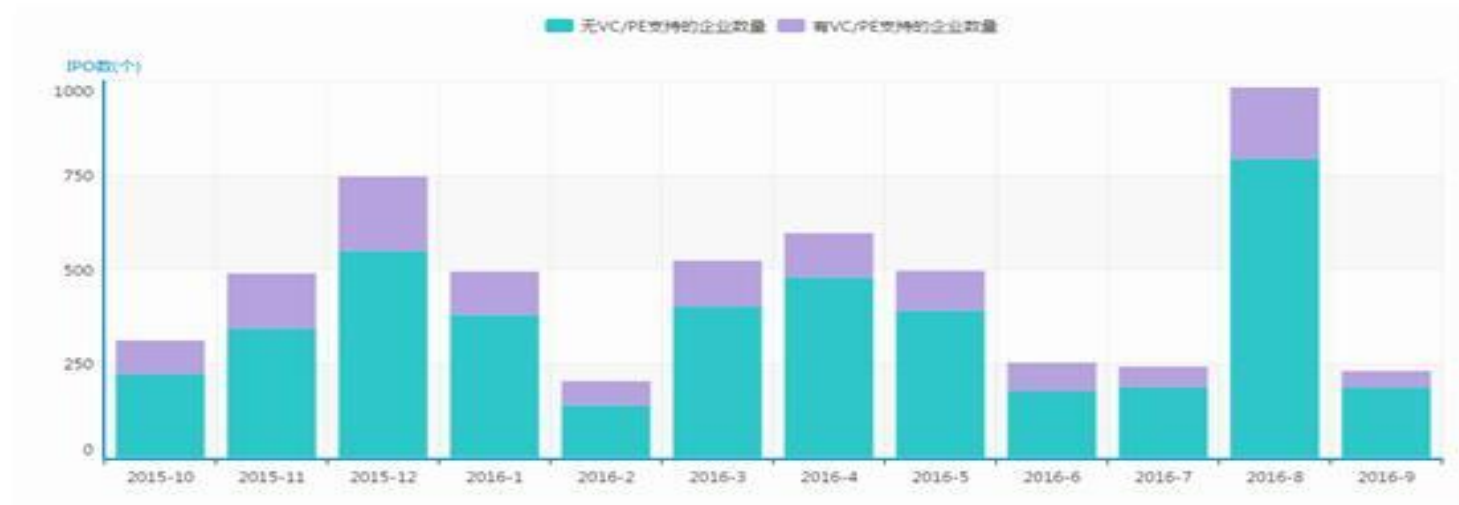
图1 新三板挂牌企业月度走势

截至到9月，新三板企业总股本达到5251.19亿股，总市值为35430.21亿元人民币，股票平均市盈率为26.86倍。本月新三板成交额总体较上月有小幅上涨，协议转让额略高于做市转让。本月三板成指最高点出现在9月19日，点数为1193.72，当日成交约1.28亿股，成交额约为9.04亿元人民币。9月30日，三板成指收于1162.90点。受众多利好政策的影响，三板做市指数在9月初触底回升，并在9月6日至12日出现五连阳。本月三板做市指数最高点为1098.63点出现在9月23日，此后出现回落，9月30日收于1093.77点。