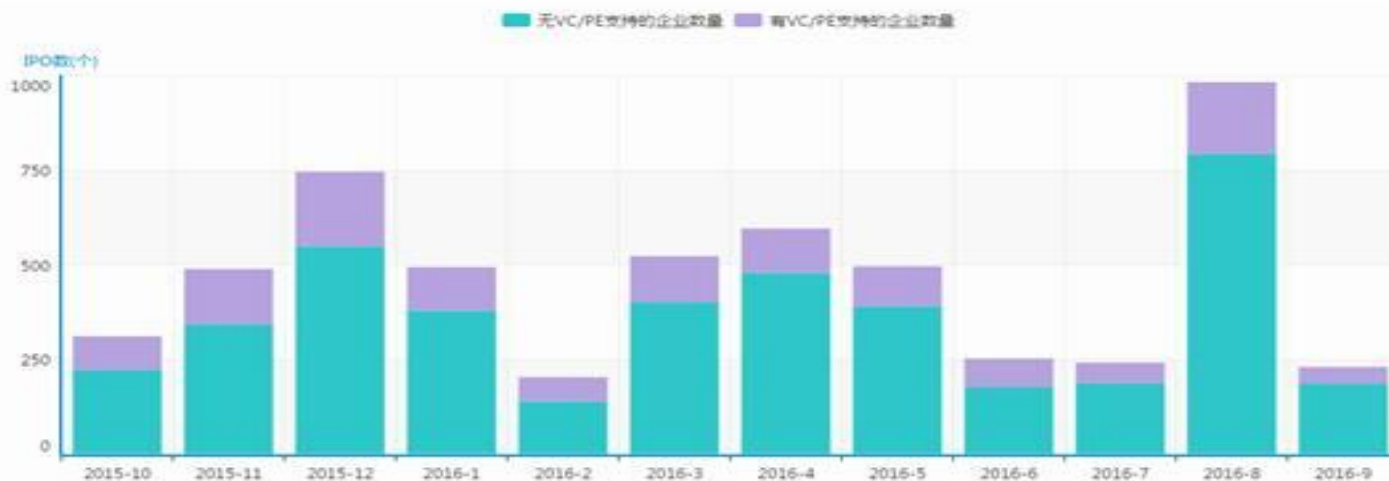
图1 新三板挂牌企业月度走势

根据清科旗下私募通统计，截止到9月新三板挂牌公司共9122家，其中做市转让1640家，协议转让7482家，共有953家企业进入创新层。8月份因股转系统去库存等原因，挂牌企业数飙涨并创下历史新高。本月企业挂牌步伐恢复正常，新增新三板挂牌企业230家，环比降低76.60%，略低于今年6、7月份的挂牌数量。在所有挂牌企业中，有VC/PE支持的共有44家，占比19.13%，环比下降了76.84%。