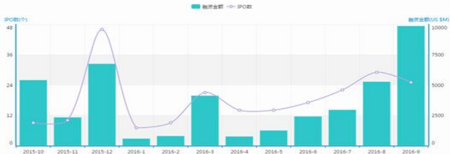
图1 IPO数量和融资金额月度走势

根据清科集团旗下私募通数据显示，2016年9月全球共有25家中国企业完成IPO，IPO数量环比减少13.79%，同比增加733.33%。中企IPO总融资额为98.59亿美元，融资额环比增加87.39%，同比增加14849.29%。本月完成IPO的中企涉及11个一级行业，登陆4个交易市场，中企IPO平均融资额为3.94亿美元，单笔最高融资额74.18亿美元，最低融资额1158.51万美元。25家IPO企业中13家企业有VC/PE支持，占比52.00%。本月金额最大的三起IPO案例为：邮储银行上市（7417.96百万美元），三角轮胎上市（677.69百万美元），新天然气上市（163.73百万美元）。