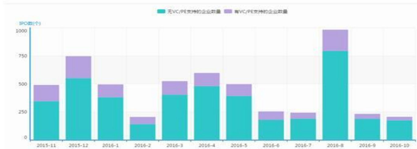
图1 新三板挂牌企业月度走势

根据清科旗下私募通统计，截止2016年10月新三板挂牌企业数量达到9324家。其中采用做市方式转让的企业共1646家，占比约为17.65%。从市场分层来看，10月份共有953家为创新层企业，与上月相比并未出现变化。受国庆节假期影响，10月份新三板正常交易日仅为16天，月度挂牌企业数有所回落。本月新增挂牌企业共204家，环比降低11.30%。在所有挂牌企业中，有VC/PE支持的共有31家，占比15.20%，环比下降29.55%。