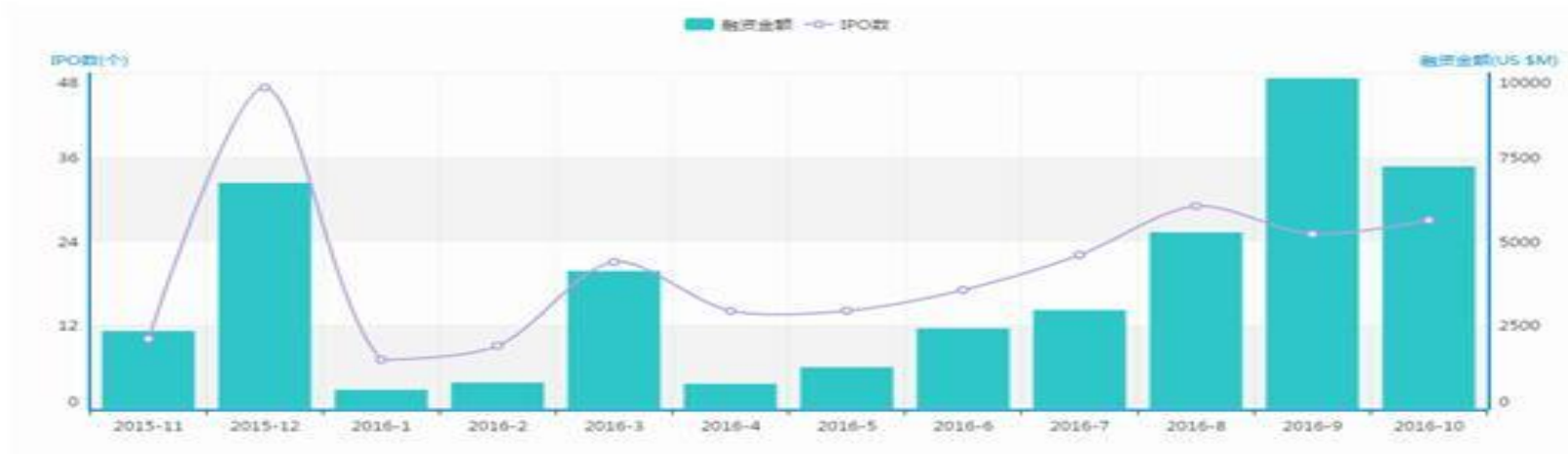
图1 IPO数量和融资金额月度走势

根据清科集团旗下私募通数据显示，2016年10月全球共有27家中国企业完成IPO，IPO数量环比增加8.00%，同比增加200.00%。中企IPO总融资额为72.26亿美元，融资额环比减少26.71%，同比增加33.92%。本月完成IPO的中企涉及13个一级行业，登陆5个交易市场，中企IPO平均融资额为2.68亿美元，单笔最高融资额18.08亿美元，最低融资额735.27万美元。27家IPO企业中18家企业有VC/PE支持，占比66.67%。本月金额最大的三起IPO案例为：华润医药上市（18.08亿美元），中通快递上市（14.06亿美元），招商证券上市（13.77亿美元）。此外，兴业证券香港子公司——兴证国际（证券代码：08407.HK）在本月登陆香港创业板，不计入月报统计。