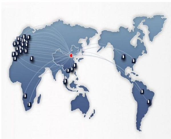
大成全球化法律服务网络

大成律师事务所成立于1992年，是中国成立最早的合伙制律师事务所之一。经过二十年的努力，大成已发展成为亚洲规模最大的律师事务所——截至2011年12月，大成总人数超过2600名，境内分所35家，境外分支机构、代表处26家，大成全球法律服务网络基本建成。