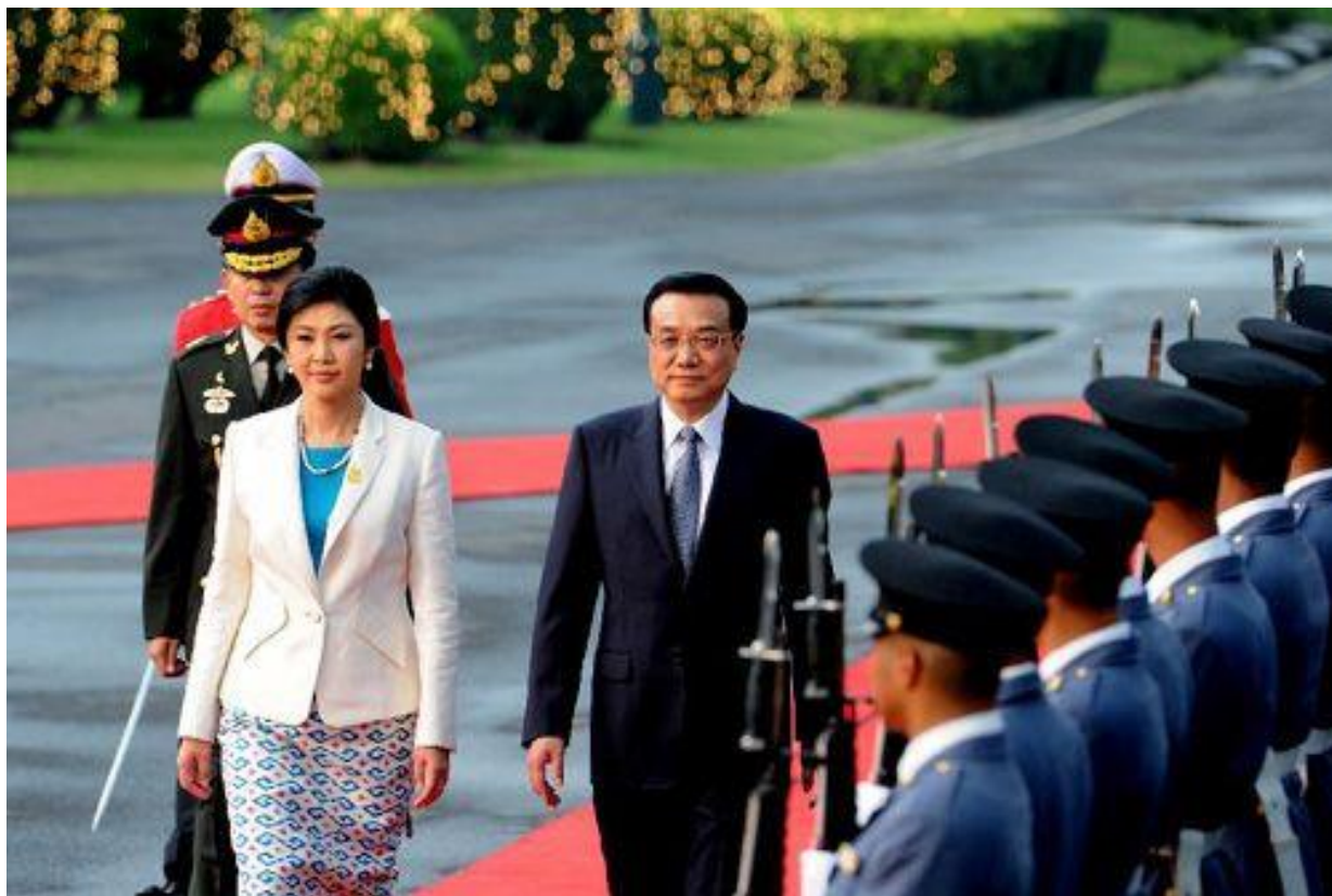
（2013 年 10 月 11 日，国务院总理李克强访泰）