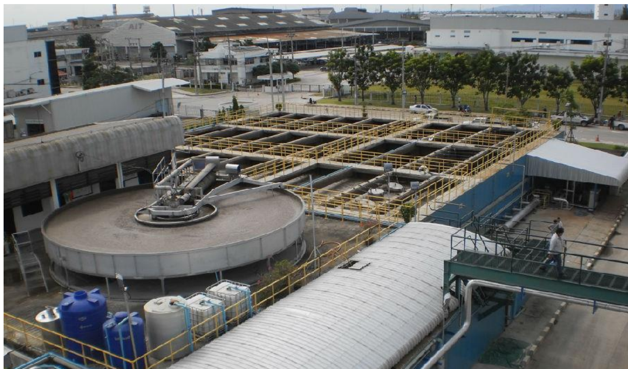
（安美德那空工业园区）

生活方面的服务也很完善，一般都设有高尔夫练习场、游泳池、羽毛球场、健身房、桑拿室以及小型电影院等。工业区还都规划出适当的住宅区供工业区中的工作人员住宿，档次有高有低，从工人到领导层都可以找到适合自己的住宅，私人别墅也是常见。不出工业区，一般都能实现日常购物、餐饮、加油，有的还配备学校供工作人员子女上学。