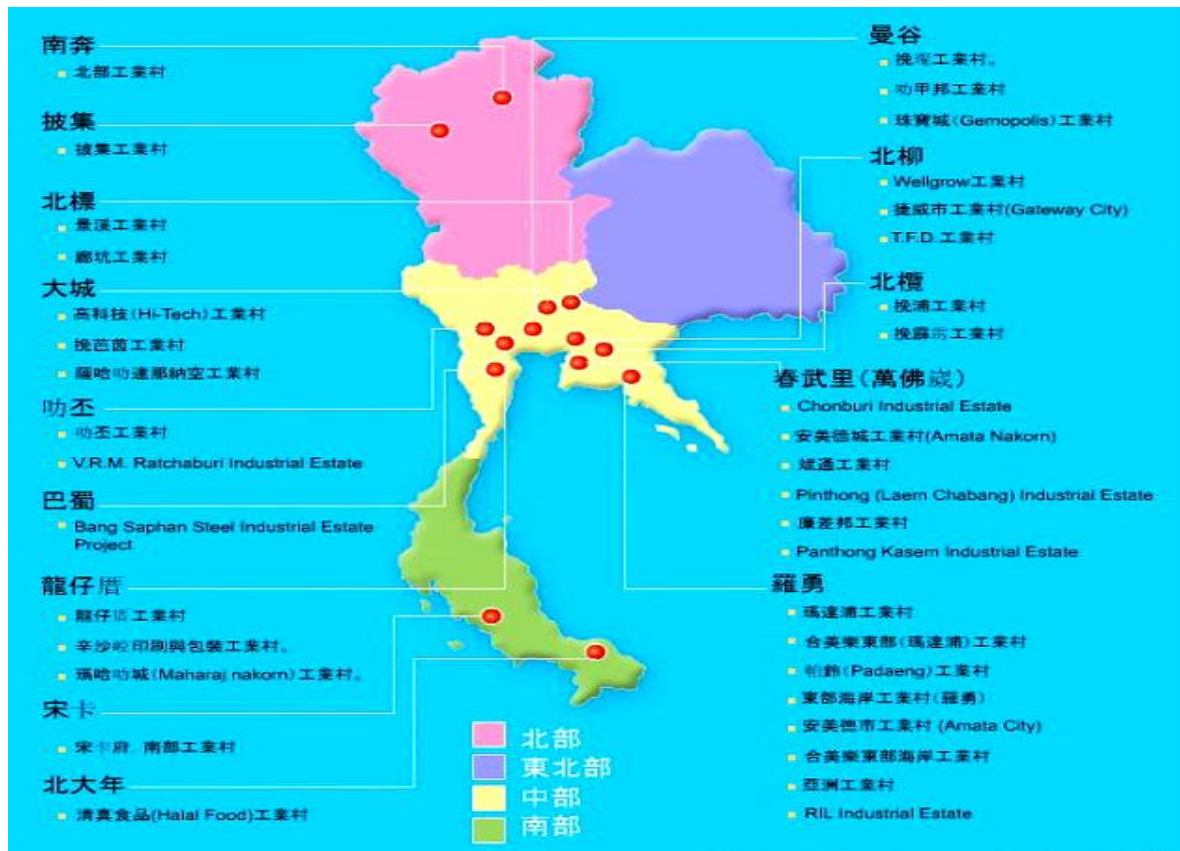
(泰国工业园区分布)