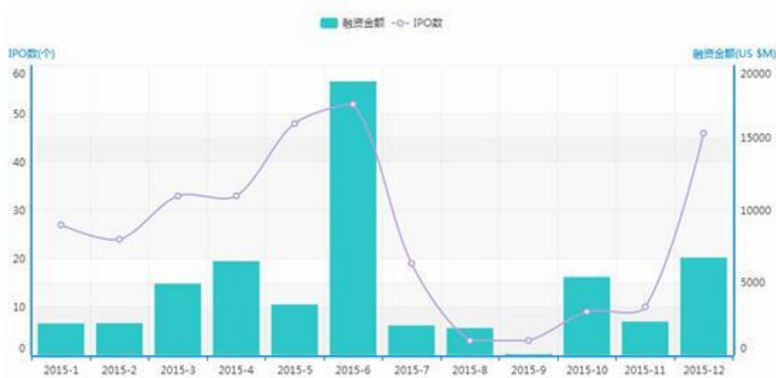
图1 2015年1月-12月IPO数量和融资金额

根据清科集团旗下私募通数据显示，2015年12月全球共有46家中国企业完成IPO，IPO数量环比增加360.00%，同比增加31.43%。中企IPO总融资额为67.37亿美元，融资额环比增加190.89%，同比减少51.19%。12月完成IPO的中企涉及16个一级行业，登陆8个交易市场，中企IPO平均融资额为1.46亿美元，单笔最高融资额19.64亿美元，最低融资额285.00万美元。46家IPO企业中22家企业有VC/PE支持，占比47.83%。12月金额最大的三起IPO案例为：中国能源建设上市（18.05亿美元），锦州银行上市（7.93亿美元），郑州银行上市（6.56亿美元）。