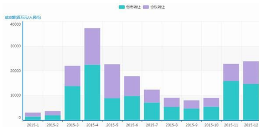
图2 新三板成交情况