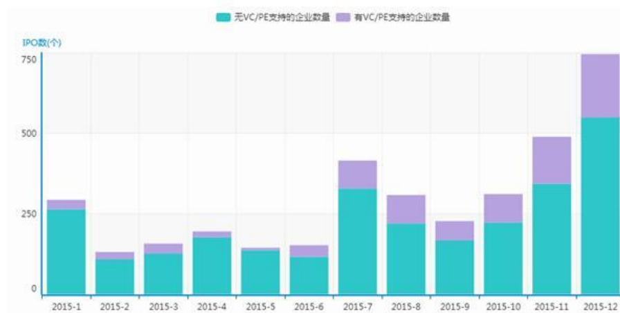
图1 新三板企业挂牌数量