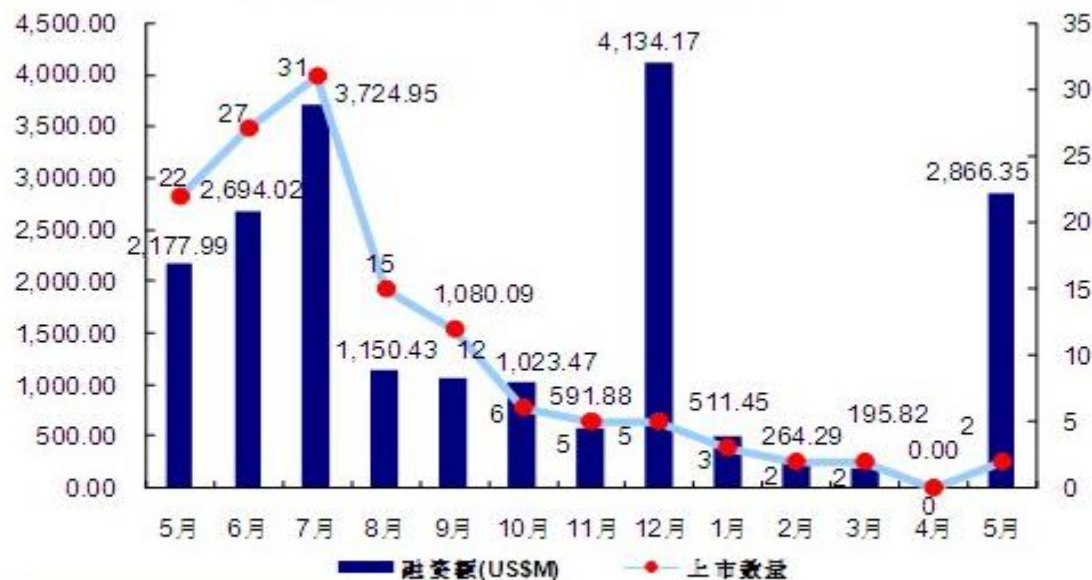
中国企业IPO数量及融资额月度比较

5月份只有2家中国企业实现IPO，上市地均为香港主板，合计融资为28.66亿美元，平均每家企业融资14.33亿美元。由于4月份没有上市企业，所以与3月份相比，上市个数持平，融资额却大大提升；而与去年相比，上市个数只有去年同期的1/11，但融资额却高出去年同期融资额的31.6%，主要是因为上市的两家企业银河证券和中石化炼化工程皆为实力雄厚的巨型企业。