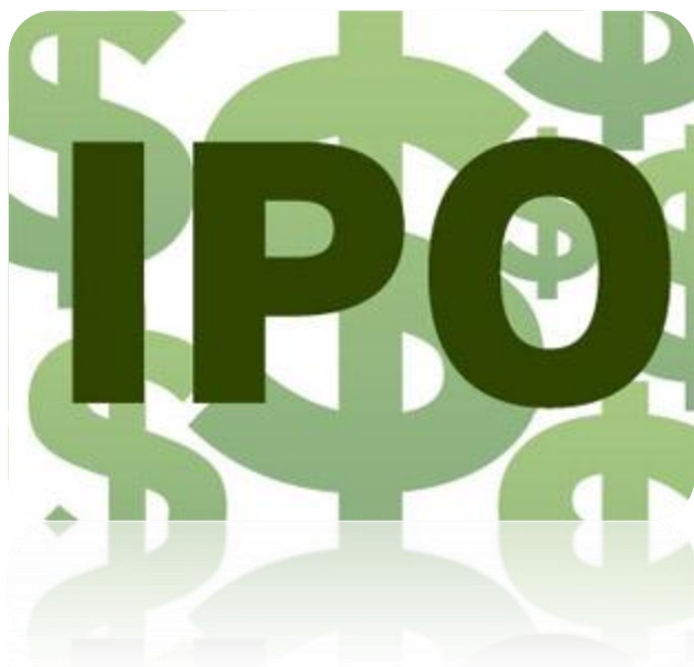
2013年上半年度全球企业IPO统计