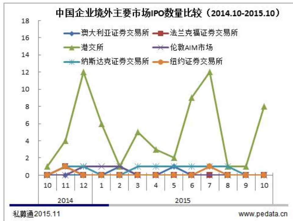
图2 中国企业境外主要市场 IPO 数量比较 (2014.10-2015.10)

根据清科研究中心观察：2015年我国资本市场经历了拆VIE架构、并购潮、新三板热、股灾等，以及现在的“寒冬”资本市场，在寒冬资本市场影响下，不仅10月的中企IPO融资规模下调，未来的中企IPO可能在融资规模上做下调，减少IPO的融资规模。近期全球二级市场的回暖，10月中企IPO于港交所登陆基本回归常态，港交所有望承载更多的中企IPO，推进中企IPO登陆港交所项目的进展。